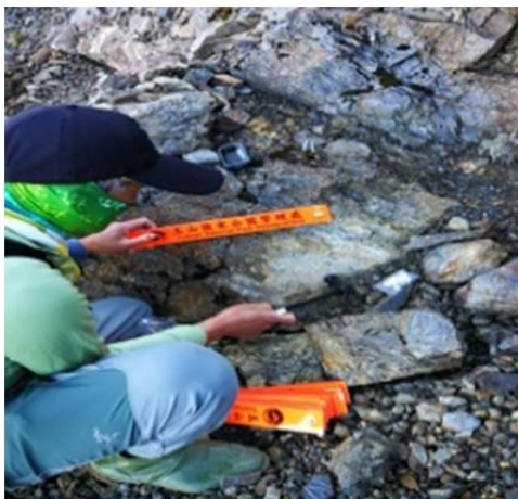
圖 1、設置橘色反光路標，請注意通行