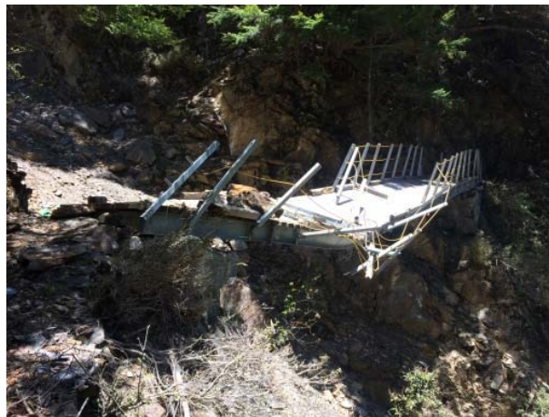
圖 6、棧橋毀損，請沿著山壁小心通過