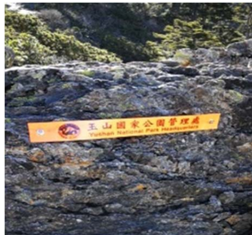
圖 2、設置橘色反光路標，請注意通行