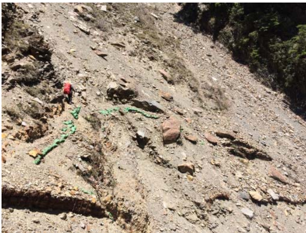
圖 5、大面積崩塌坡面，請小心通行