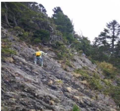
圖 3、崩壁請小心通過