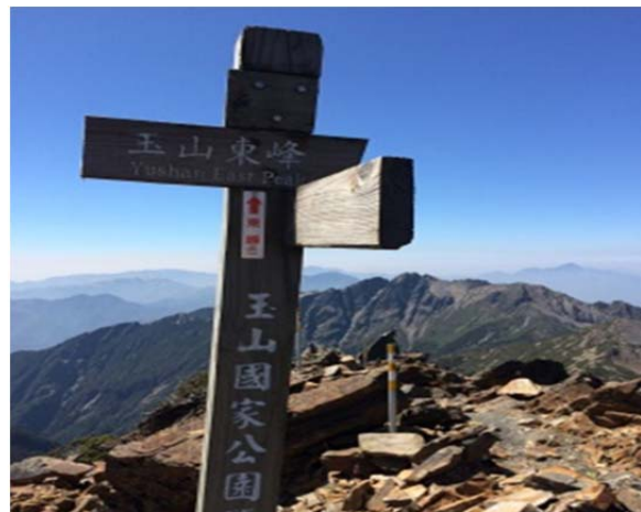
圖 2、易迷失區，請注意指引牌及反光柱