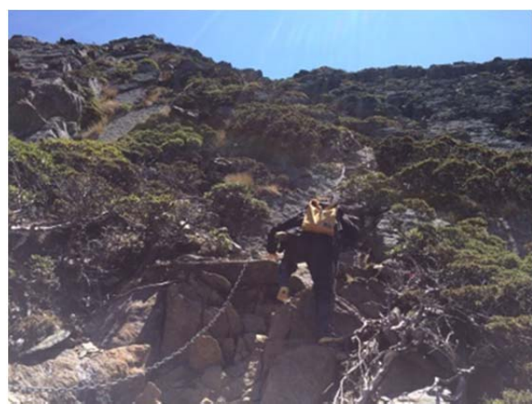
圖 4、陡坡落差大，須具有攀岩技巧