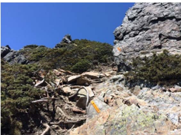
圖 3、參考簡易橘色反光路標牌，輔助辨識