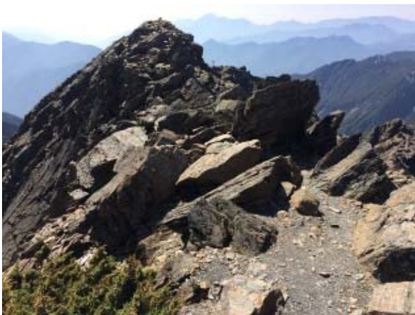
圖 1、稜線亂石區，注意路跡，小心通行