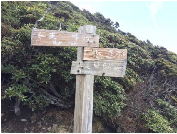
圖 1、三向指示牌，請認明方向