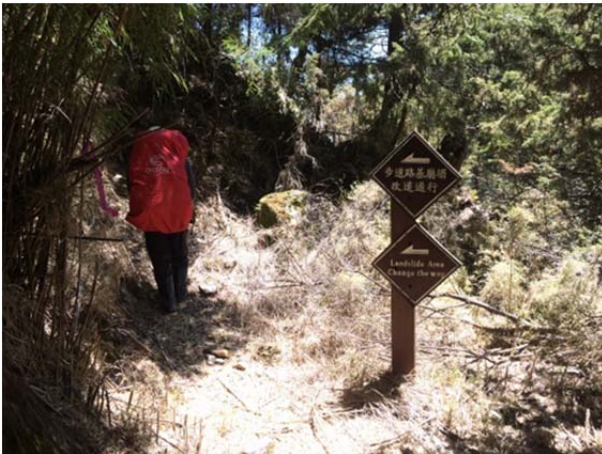
圖 3、步道須高繞過崩壁，請注意牌示