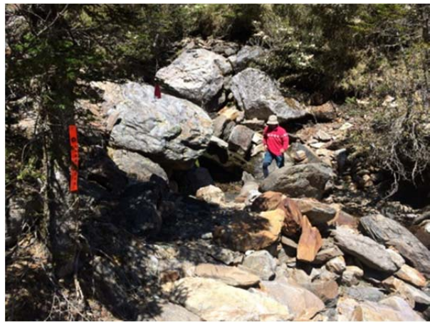
圖 2、設置橘色反光路標，請注意通行