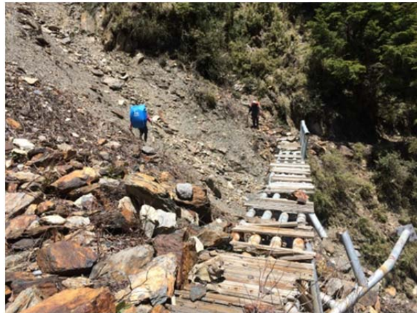
圖 4、棧橋毀損，請小心通過崩壁