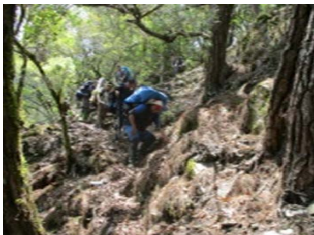
圖 8、陡坡易滑，請靠斷崖內側小心通行