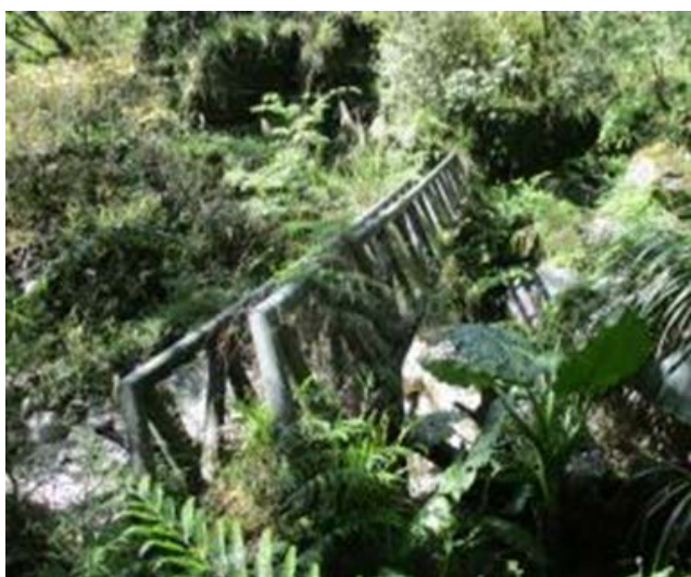
圖 3、棧橋傾斜毀損、橋基不穩，請注意