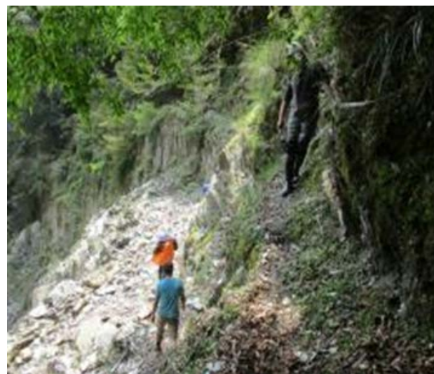
圖 11、路基坍塌、斷崖，請靠內側小心通行