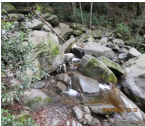
圖 6、過溪，請注意水流狀況小心通過