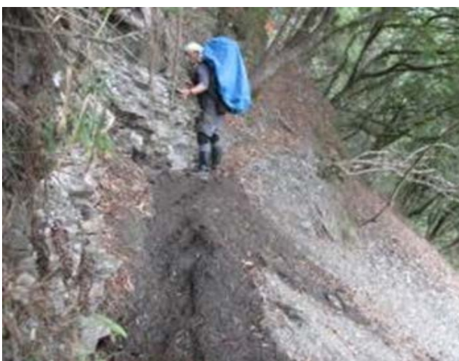
圖 4、步道坍方，路基狹窄，請注意通行