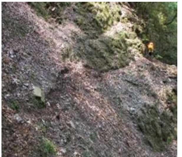
圖 12、坍塌路段，請小心通行