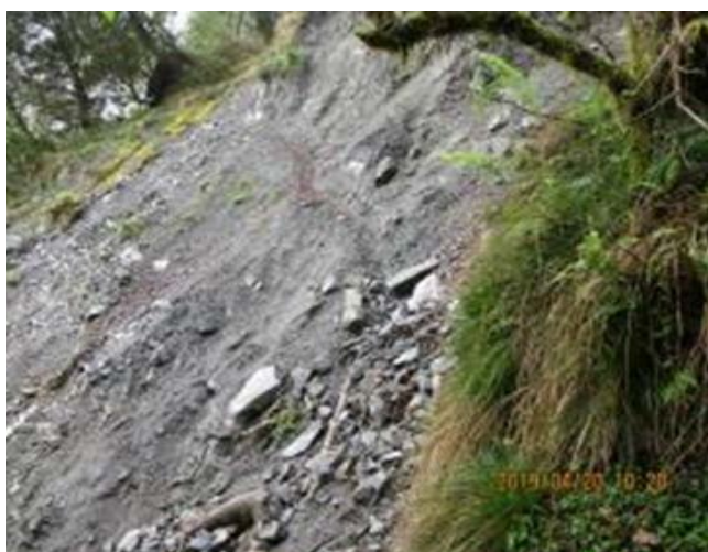
圖 5、崩塌，路基狹窄，請注意通行