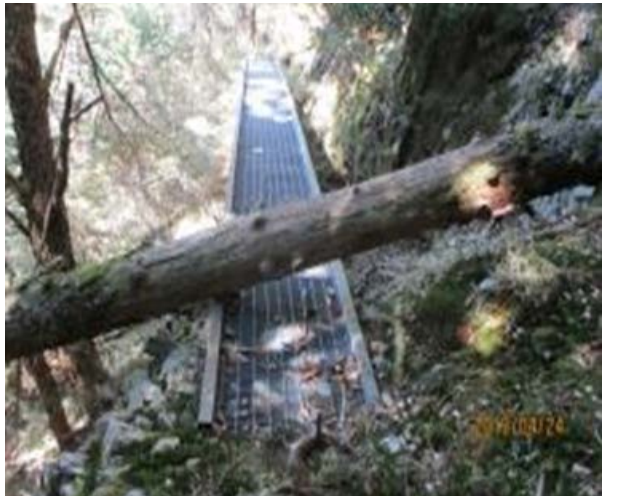
圖 10、倒木壓在棧橋上，請小心通行