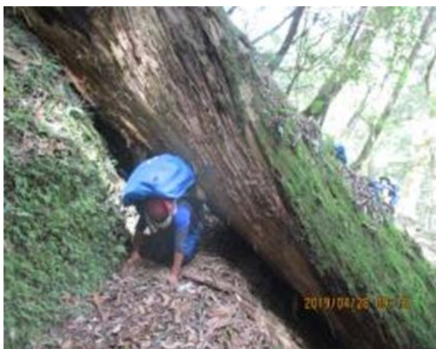
圖 9、倒木阻隔通行，可從下方鑽過