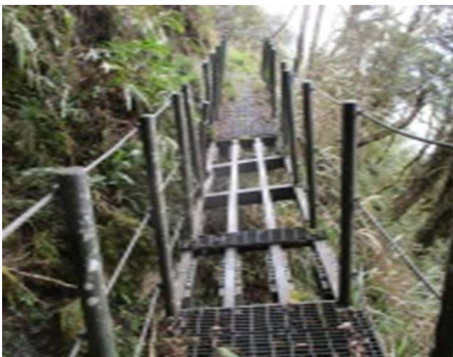
圖 2、棧橋落石擊中毀損，請注意通行