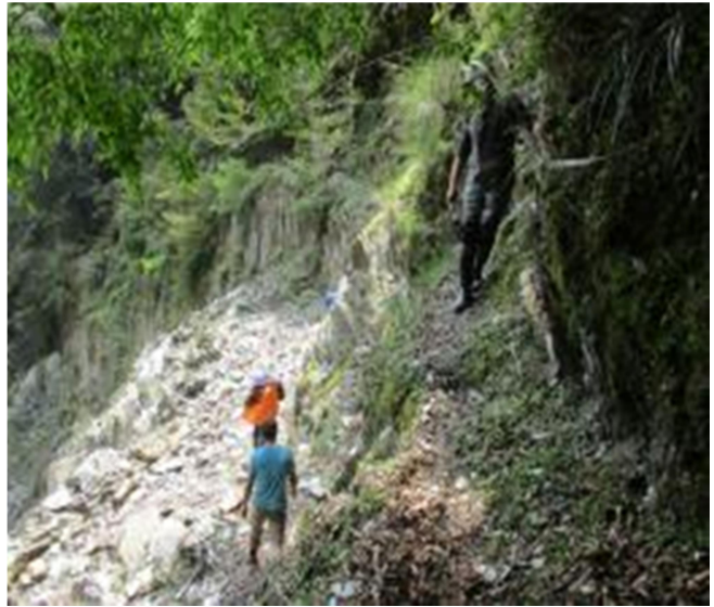
圖8、路基坍塌、斷崖，請靠內側小心通行