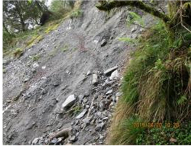
圖2、崩塌，路基狹窄，請注意通行