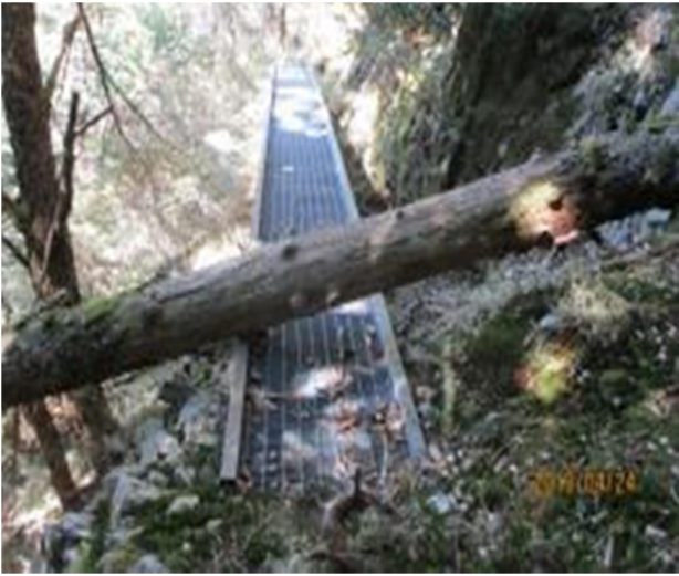
圖7、倒木壓在棧橋上，請小心通行