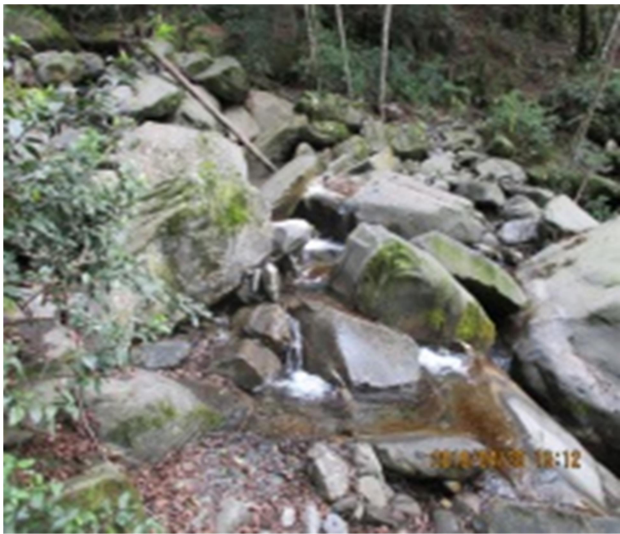
圖3、過溪，請注意水流狀況小心通過