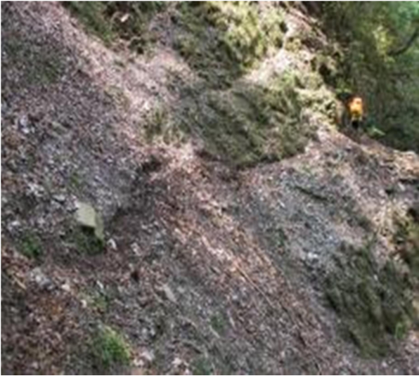
圖9、坍塌路段，請小心通行