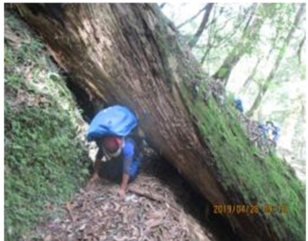
圖6、倒木阻隔通行，可從下方鑽過