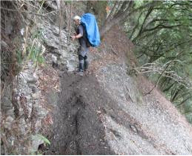
圖1、步道坍方，路基狹窄，請注意通行