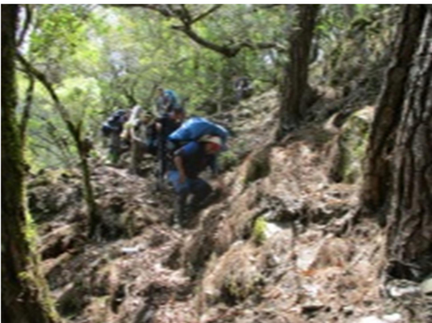
圖5、陡坡易滑，請靠斷崖內側小心通行