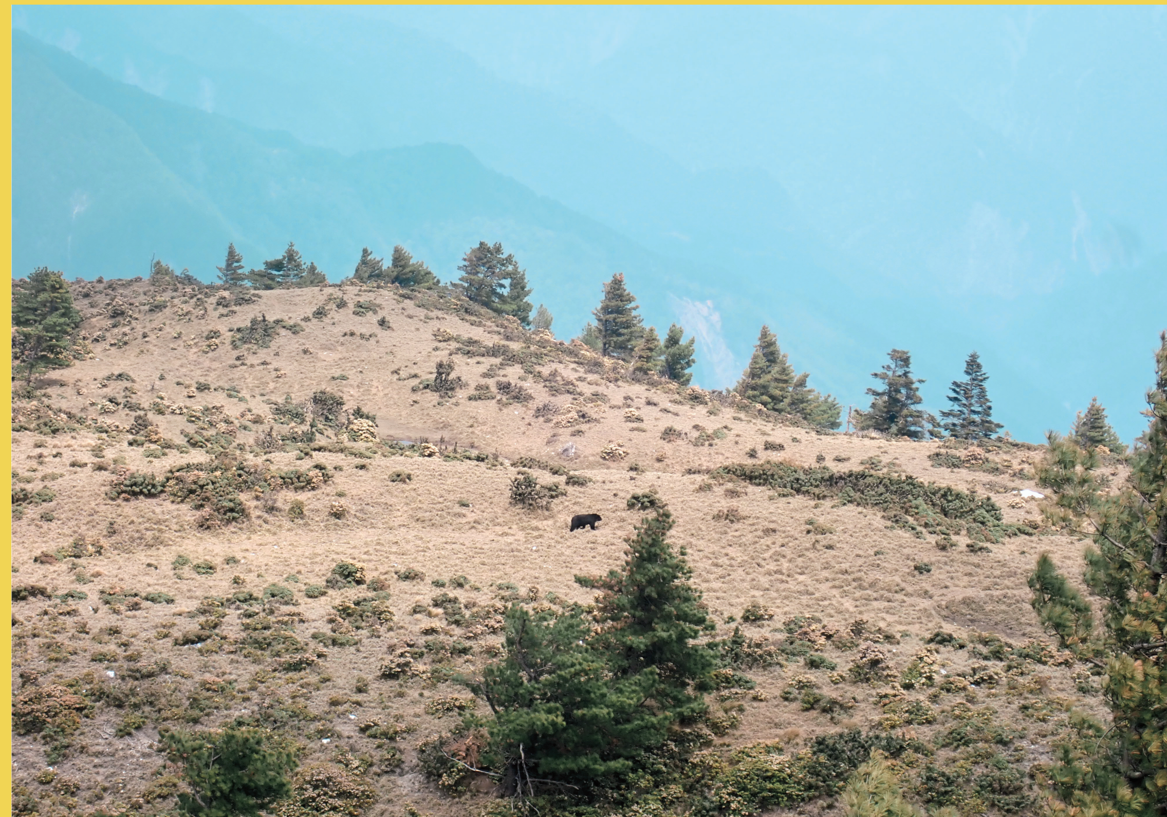
漫步於八通關大草原的臺灣黑熊