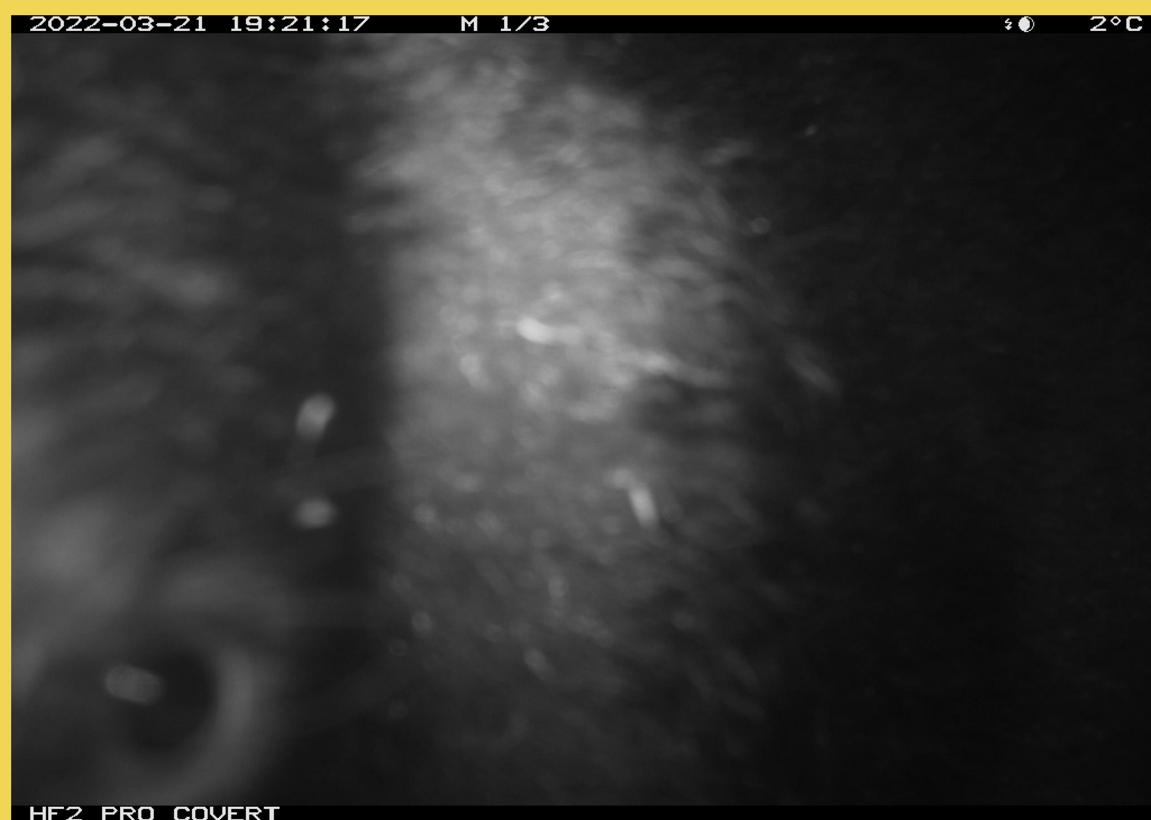
於圓峰山屋附近拍攝到的臺灣黑熊