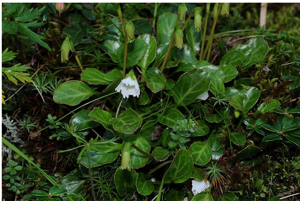
圖 11. 裂緣花開花植株。