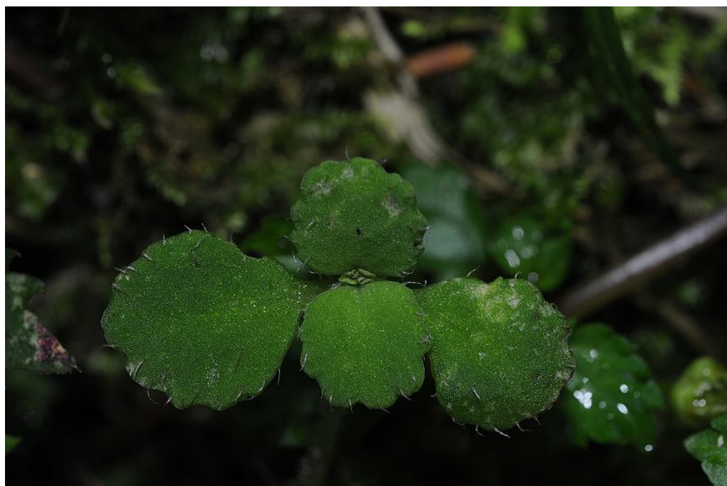
圖 15. 大武貓兒眼睛開花植株。