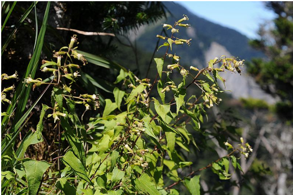
圖6. 能高蟹甲草開花植株。