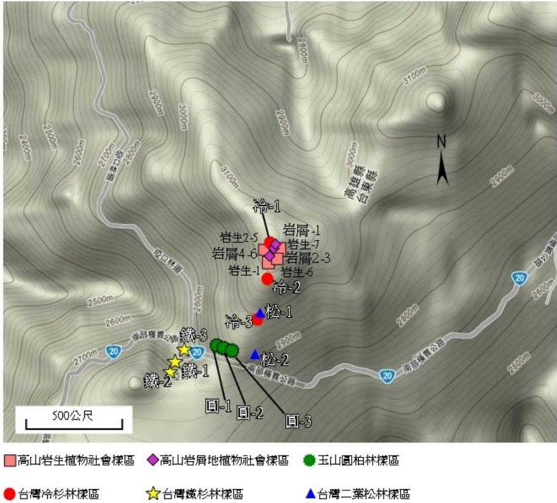
圖1. 調查樣區分布圖。