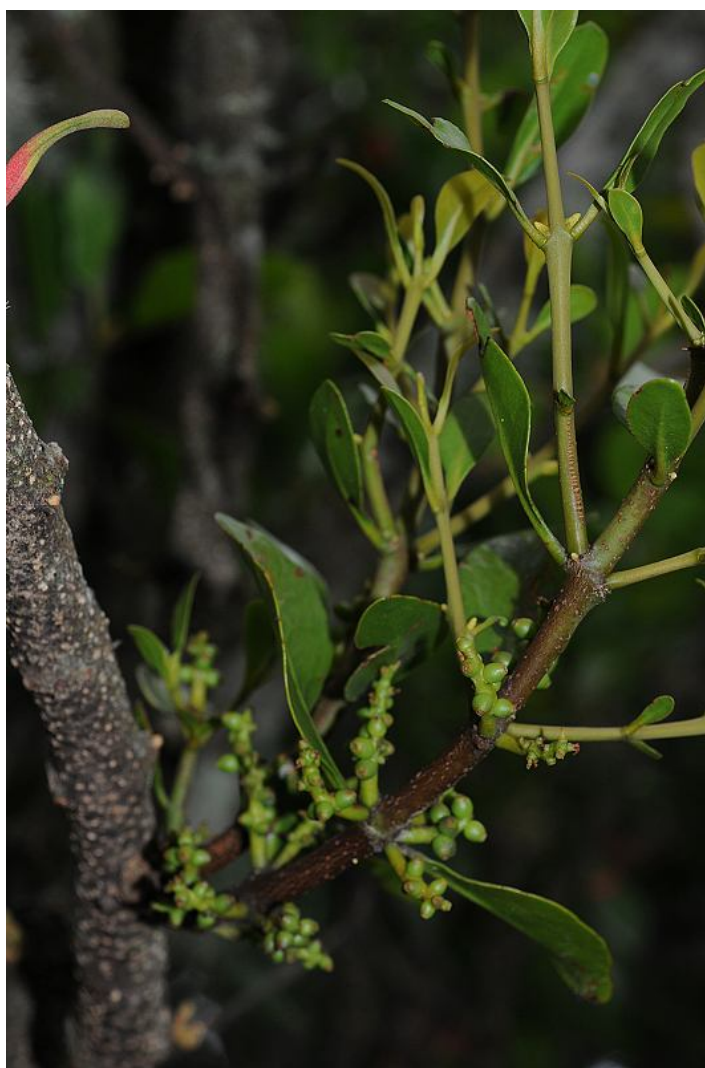
圖 14. 高氏桑寄生開花植株。