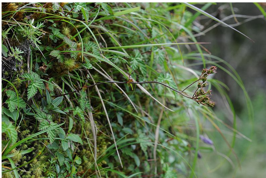
圖 17. 臺灣蚊子草結果植株。