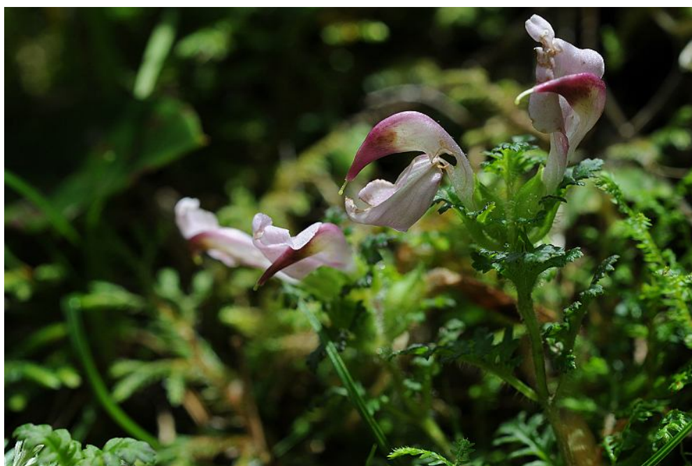
圖 10. 高山馬先蒿開花植株。