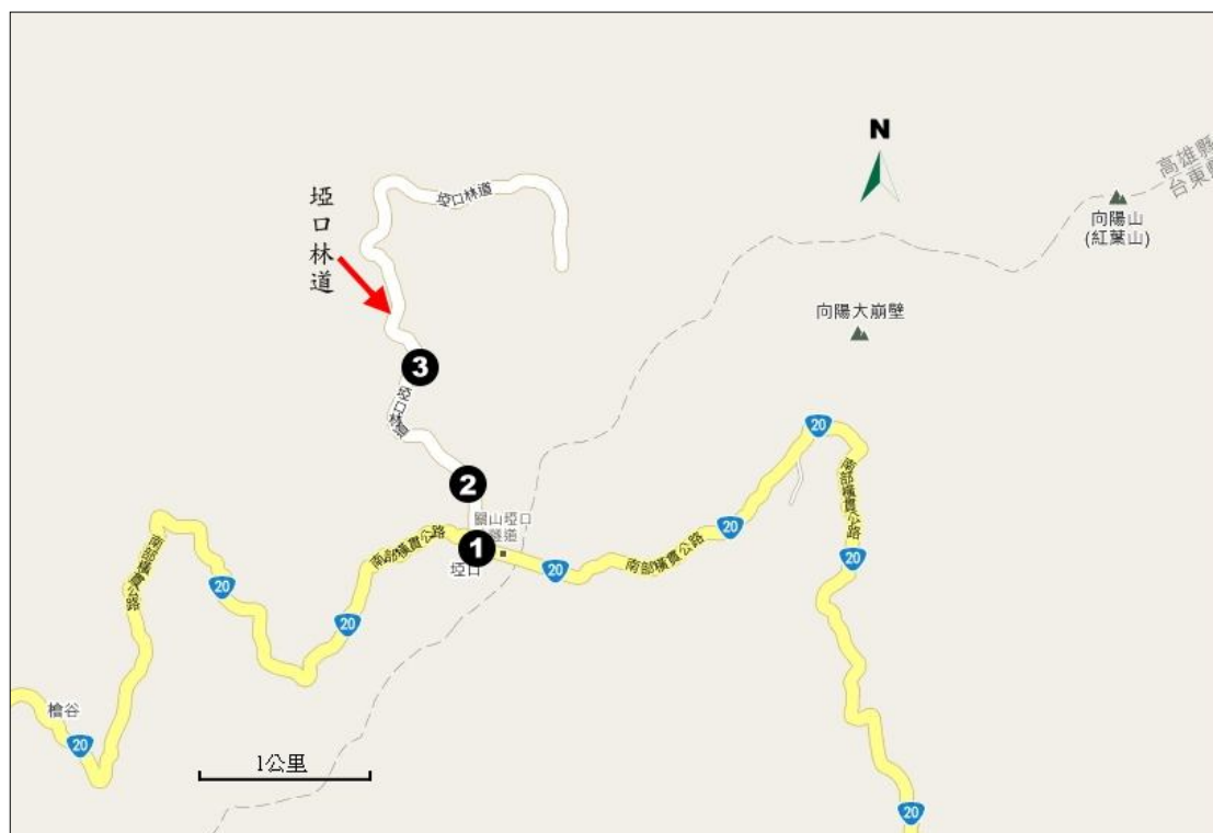
圖 3. 埡口林道路線圖。1 表示林道入口；2 表示莫拉克風災後新產生之崩塌地；3 表示 2009 年可通行之區域，目前因林道入口崩塌，已經完全無法通行。

道路兩側以褐毛柳、台灣二葉松、為主，高山芒亦頗為常見，此外常見植物有玉山假沙梨、台灣華山松、玉山杜鵑、台灣馬醉木、台灣小檗、假皂莢、鄧氏胡頹子等木本植物。林道地面生有多種草本植物，常見的植物有山艾、細葉山艾、黃斑龍膽、雪山堇菜、台灣草莓、台灣款冬、台灣烏頭、咬人貓、疏脈繁縷、刺果豬殃殃、圓葉豬殃殃、能高刀傷草、山牻牛兒苗、高山薔薇、玉山懸鈎子、阿里山薊、高山當藥、鹿場毛茛等。道路邊緣山壁上常見植物有台灣常春藤、台灣莓、掌鳳尾蕨、玉山佛甲草、梅花草等多種植物。