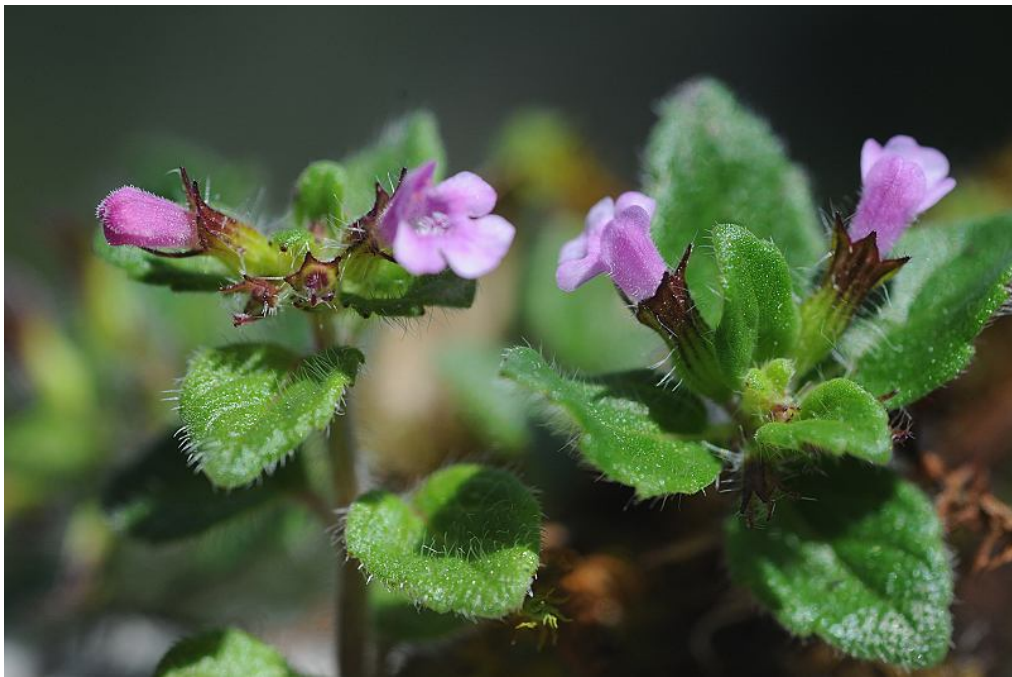
圖8. 臺灣風輪菜開花植株。