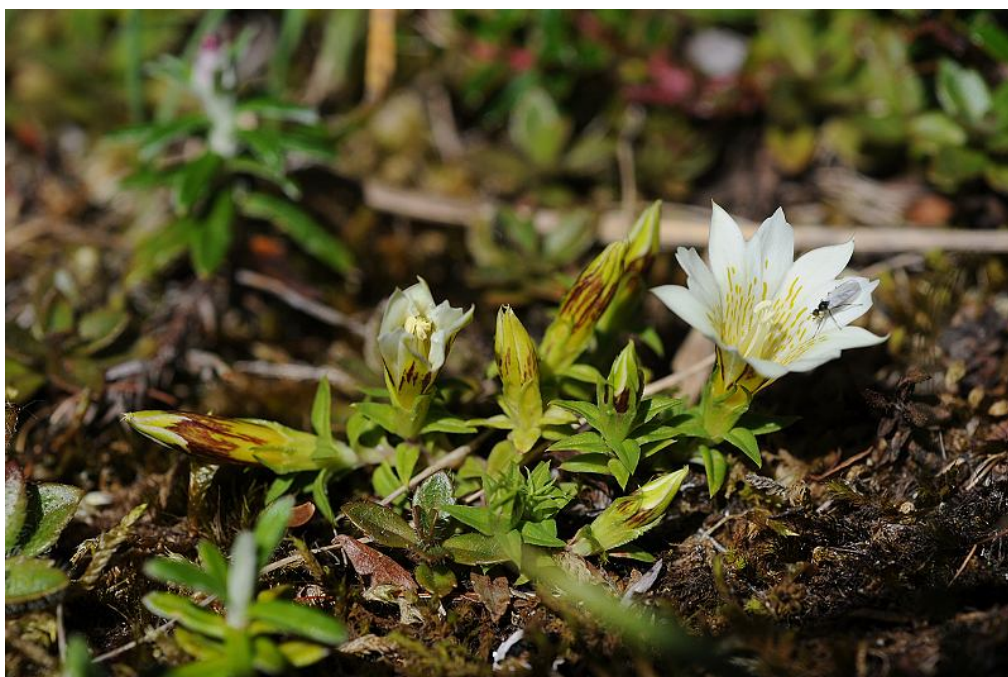
圖 13. 高雄龍膽開花植株。