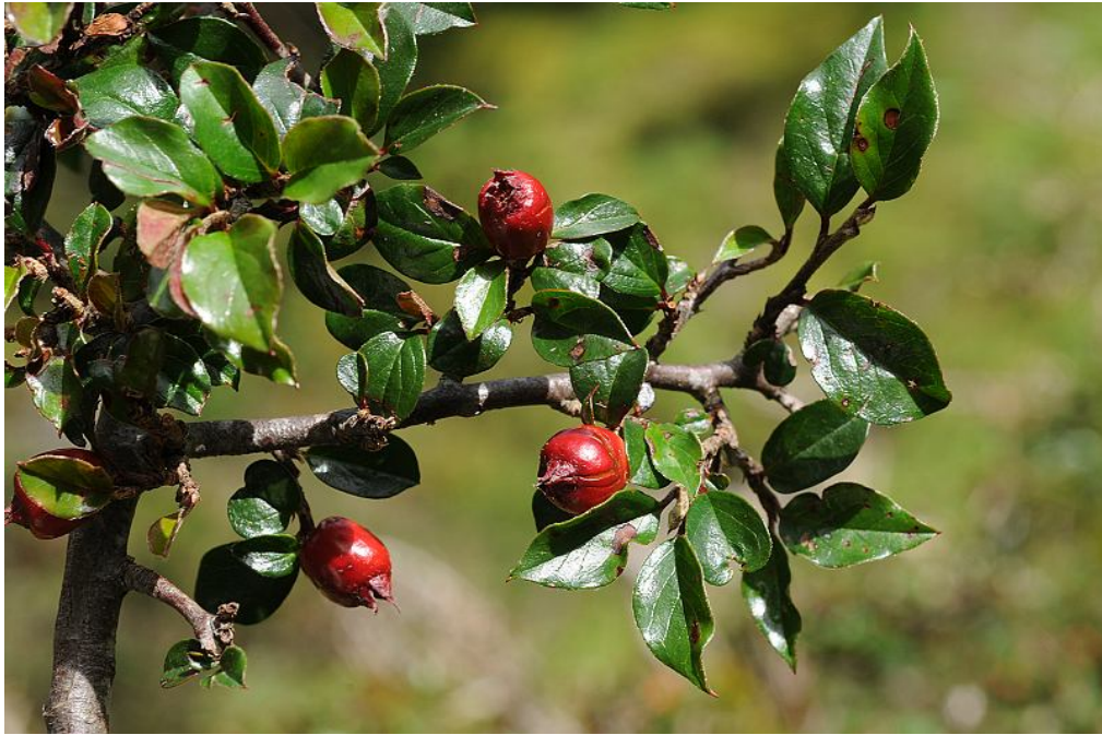
圖 16. 平枝鋪地蜈蚣結果植株。