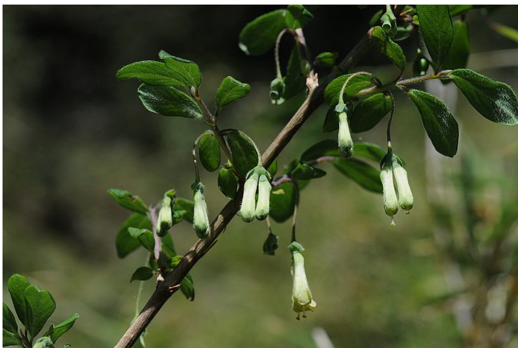
圖7. 川上氏忍冬開花植株。