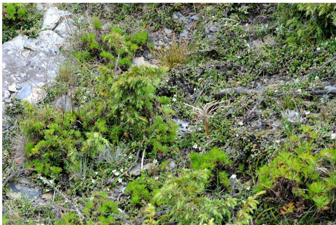
圖 5. 高山岩屑地植物社會樣區。此類樣區以灌木本植物為主。

從開放式草本植物社會至灌叢植物社會的演替過程中，木本植物刺柏、玉山圓柏、高山薔薇、玉山箭竹逐漸取得優勢，而高山艾、玉山鋪地蜈蚣、玉山懸鉤子、高山翻白草、玉山佛甲草、玉山懸鉤子、野薄荷等低矮植物則逐漸喪失優勢。