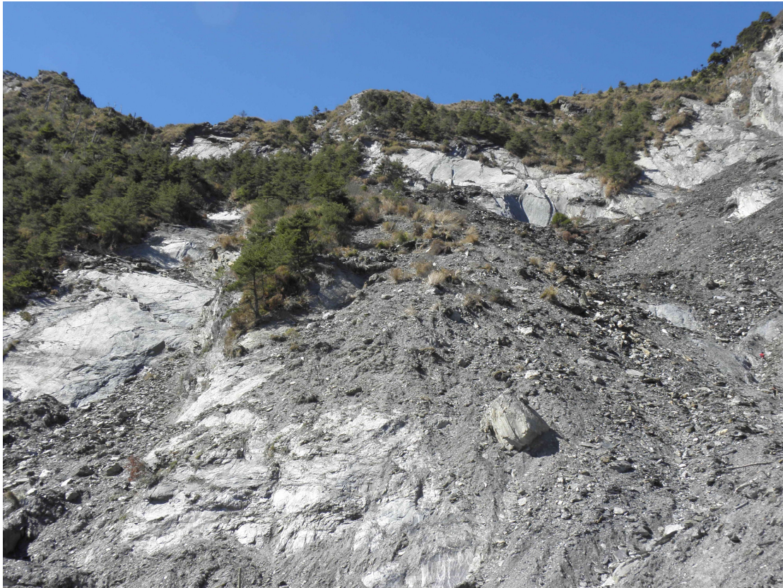
圖18. 2009年莫拉克風災後東埡口發生大面積的崩塌。地貌幾乎完全改變，台灣二葉松大量消失。