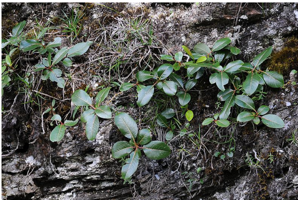
圖9. 關山嶺柳植株匍匐生長於岩壁上。