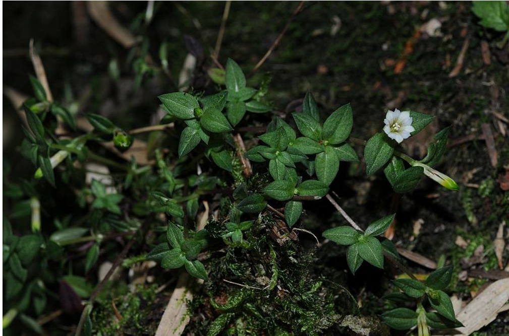
圖 12. 塔塔加龍膽開花植株。