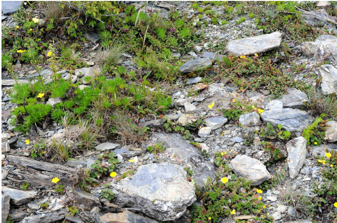
圖 4. 高山岩生植物社會樣區。此類樣區以草本植物為主。

在重要值方面，以山艾最高（18.25%），其次依序為刺柏（10.51%）、玉山鋪地蜈蚣（9.66%）、高山翻白草（7.93%）、玉山懸鉤子（7.82%）、玉山佛甲草（5.78%）、野薄荷（5.25%）等較為優勢，其餘種類重要值皆在 5% 以下。